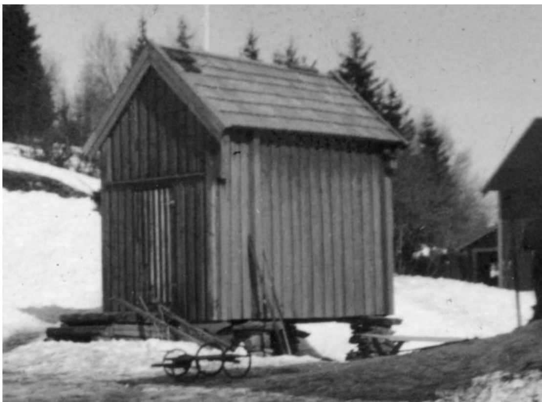
Stabburet slik det sto på Stykket på 1940-tallet.