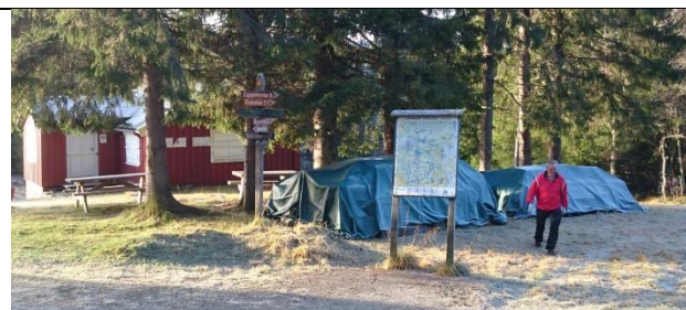
Stabburet lagret på Marken